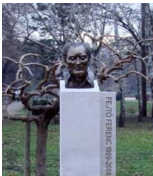
Fejtő Ferenc fejszobra