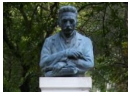
Gárdonyi Géza mellszobra