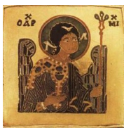
az a Bronz zománcképe (Gábrriel Arkangyal)

Mint látható, sokkal beljebb merészkedtünk és részletesebb, konkrét megállapításokhoz jutottunk ennek a Hierarchiának a tárgyalásánál, mint amikor az előzményekben kizárólag alárendelő szempontból értékeltük. Az is észrevehető, hogy azok a falak, ellentmondások, amelyek ott jelentkeztek, a Hierarchia mozgása alapján szépen és könnyedén lebonthatóak, átvértelmezhetőek. Az is látszik, hogy LÉLEK – nek sokkal szorosabb a kapcsolata a TEST – tel, mint a SZELLEME – mel. Míg a SZELLEME – mel folyamatosan elkülönül (de megmarad a szerves egysége), addig a TEST – tel sok esetben összemosódik, egylényegűvé válik. Persze itt is megmarad egy bizonyos elkülönülés (Teremtői, illetve Teremtett Minőség), de ez a különbség nem olyan jellegű, mint a SZELLEME és a LÉLEK között. Ábrázolásoknál ez olykor észrevehető, például a Magyar Szent Koronán az Apostolok, illetve a Szentek zománcképei között. Míg a Szentek képei a SZELLEME és a LÉLEK szintjét jelenítik meg, úgy az Apostolok ábrázolásai mindhárom szintet magukba foglalják (SZELLEME – LÉLEK – TEST), az úgynevezett „kulcsuk” formában, amelyben a zománckép megjelenik nincs elkülönülve az övonal, így a felosztása SZELLEME, illetve LÉLEK – TEST! Lássuk a képet: