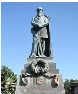
Gróf Batthyány Lajos