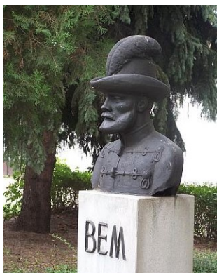
Bem József mellszobra