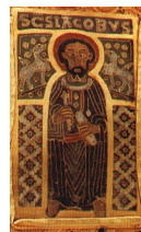
a keresztpánt zománcképe (Scs Iakobus/Szent Jakab)