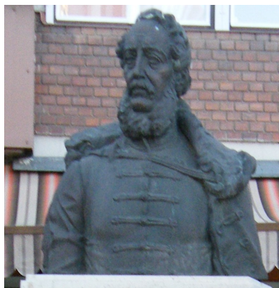
Kossuth Lajos mellszobra