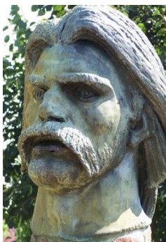
Dózsa György fejszobra