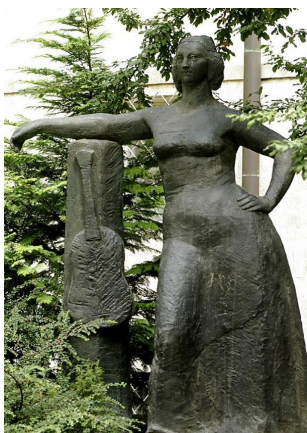
Déryné Széppataki Róza